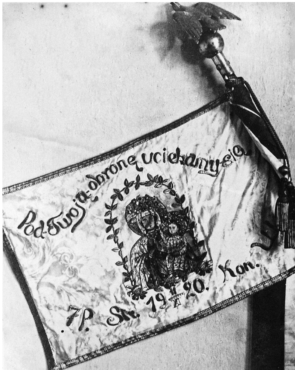
Sztandar 7. pułku strzelców konnych Wielkopolskich wręczony w 1921 r. (zbiory Sali Tradycji 15. WBKPanc)