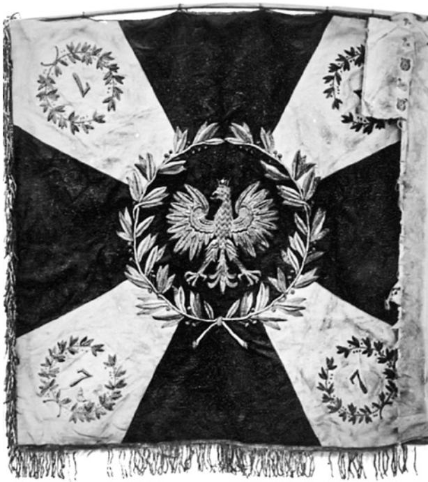
Sztandar 7. pułku strzelców konnych Wielkopolskich wręczony w 1936 r.